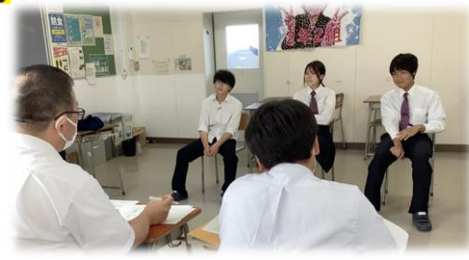
放課後の面接練習の様子

9月14日(木)に3学年の生徒たちに向けて、進路激励会が行われました。生徒たちは、9月16(土)から解禁になった就職試験に向けて、放課後遅くまで学校に残り、面接練習や作文練習などを行っています。緊張している様子も見られますが、試験本番で自分達の出せる力を全て出し切れるように、お互いに励まし合いながら準備を進めてほしいと思います。